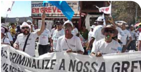
Caravana em Brasília (ago.2011)