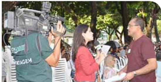
A greve foi noticiada em cerca de 30 matérias em TVs locais.