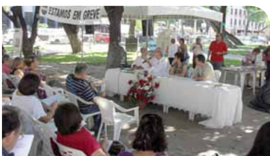
Debate sobre o Plano Nacional da Educação.

13.09 - Caravana a Brasília com a participação de cinquenta servidores técnico-administrativos da Universidade Federal do Ceará. Os trabalhadores tinham como missão realizar manifestação na Câmara dos Deputados durante a votação, na Comissão Especial, do Projeto de Lei 1749/11.