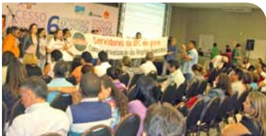
Grevistas participam da Conferência Municipal de Saúde (jul. 2011).