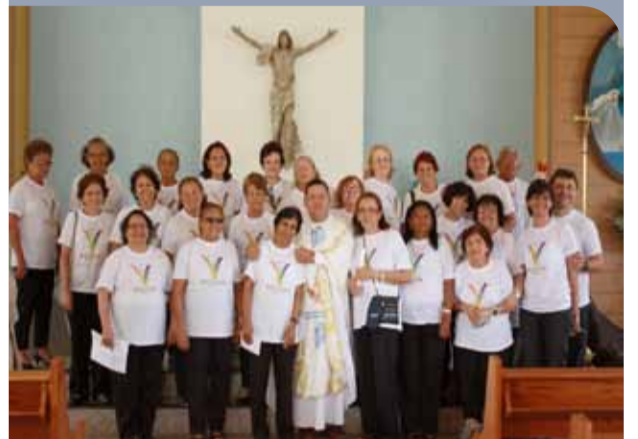
Coralistas na Igreja Nossa Senhora das Graças, na Tabuba.