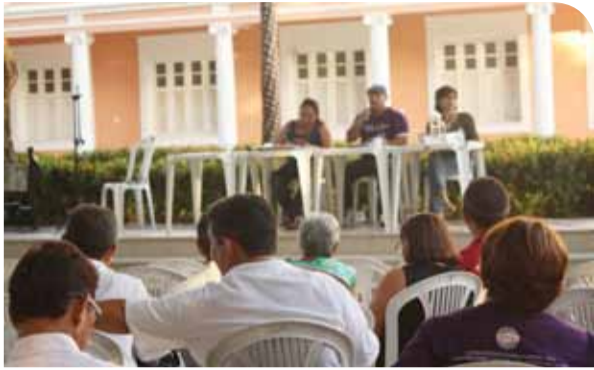
A próxima Assembleia Geral está agendada para o dia 22/11.

Confira os principais informes e encaminhamentos do último dia 3 de novembro.