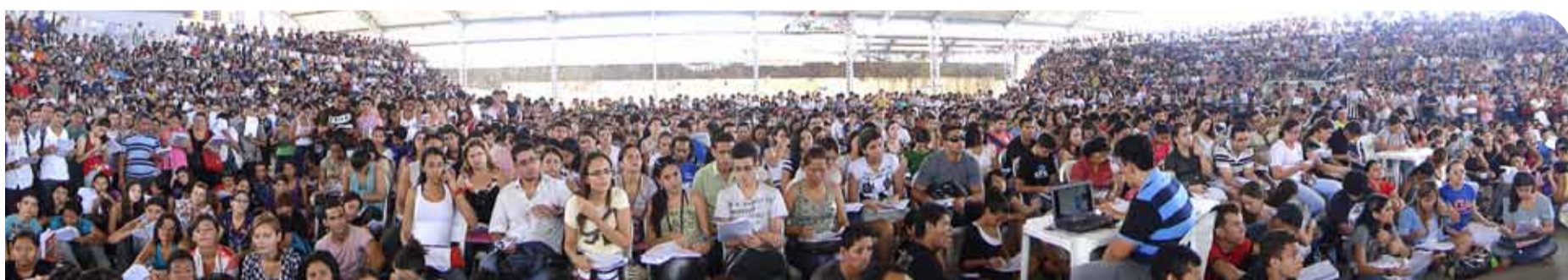
O SINTUFCE mobilizou cerca de 7 mil estudantes para o aula gratuito.

Em 2011, o Curso Pré-ENEM do SINTUFCE ganhou uma grande repercussão junto a sociedade civil. Em espaços gratuitos concedidos pela mídia - em rádio, TV e jornal impresso, os coordenadores de educação do SINTUFCE falaram e convidaram a população a participar de aulas gratuitas e simulados preparatórios para o ENEM que reuniram multidões de estudantes de escolas públicas e também particulares.