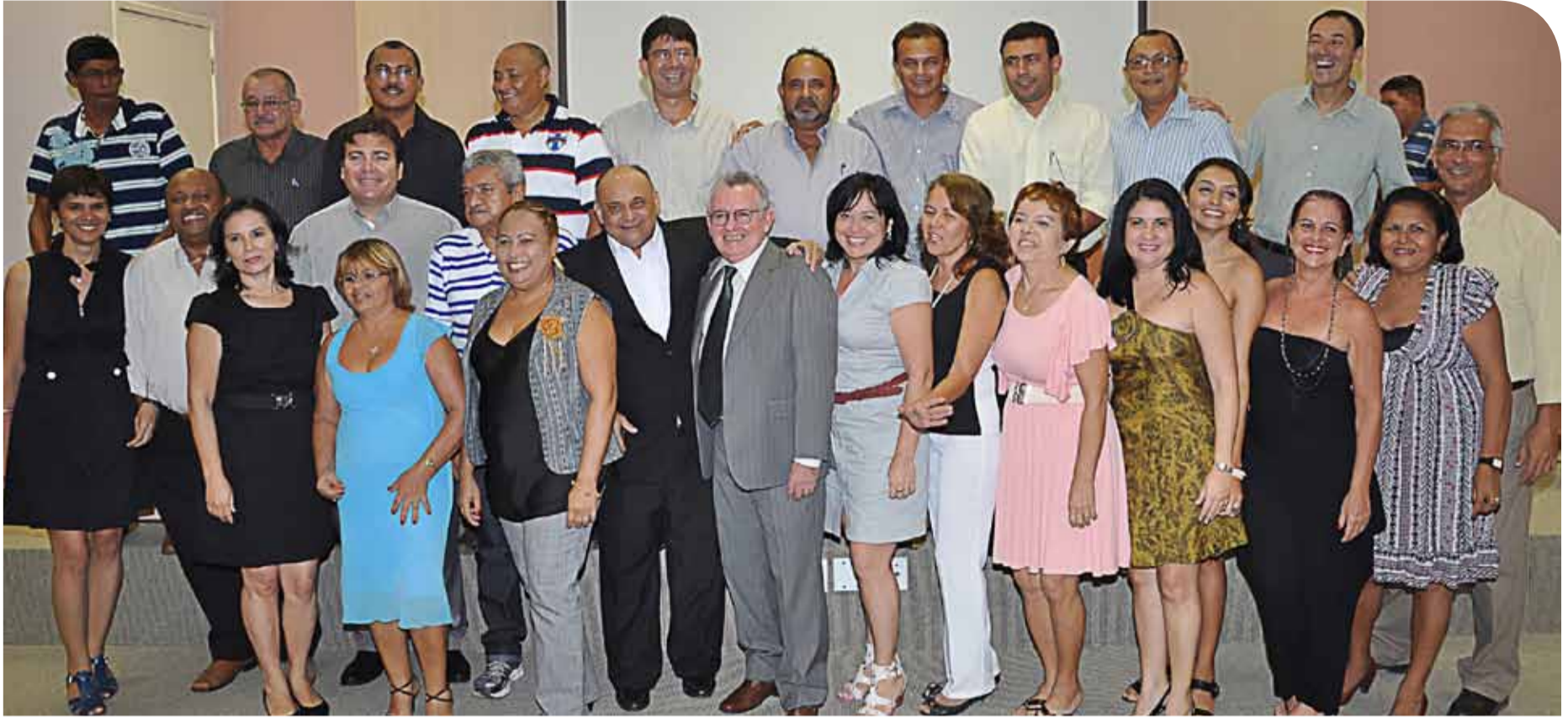
Diretoria colegiada eleita para o triênio 2011-2014, ao lado de apoiadores.