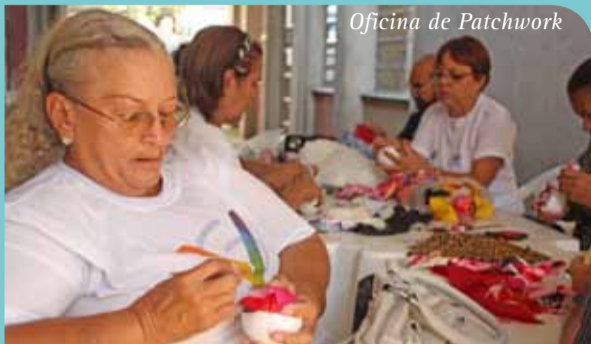
Oficina de Patchwork