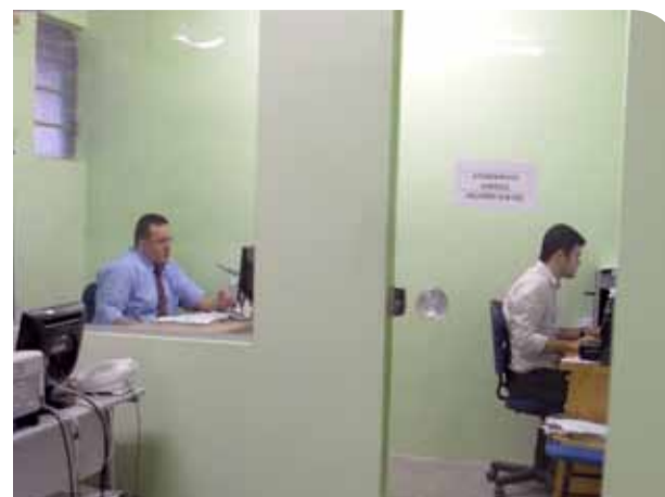
Atendimento jurídico diário na sede do SINTUFCE.