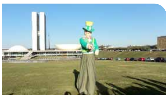
Caravana em Brasília.