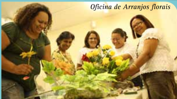
Oficina de Arranjos florais

No período de 24 de outubro a quatro de novembro de 2011, o Sindicato dos Trabalhadores das Universidades Federais no Estado do Ceará realizou uma série de atividades para os servidores da UFC. A Semana do Servidor Público Federal do SINTUFCE ofereceu apresentações artísticas, palestras, debate e festa de confraternização. Também foram realizados, em parceria com a Superintendência de Recursos Humanos (SRH) da UFC, um almoço, oficinas e uma corrida no campus do Pici.