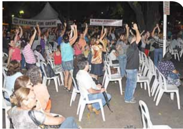
Assembleia Geral no Pátio da Reitoria (12/07/11)

A paralisação foi suspensa, mas a luta continua.