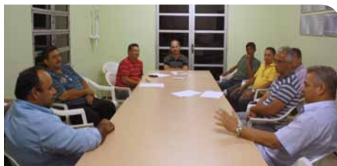
Reunião dos vigilantes na sede do SINTUFCE.

Para o diretor, "no momento em que todos os trabalhadores e trabalhadoras da Universidade Federal do Ceará incorporarem a ideia de mudanças em suas práticas e ações, surgirá a necessidade de uma reflexão sobre a finalidade e a importância de uma política de segurança. Partindo do princípio de se produzir uma vigilância dinâmica, atualizada e adaptada às exigências de seus usuários, surgiu a ideia de elaborar um seminário nacional que congregasse toda a categoria em nível nacional".