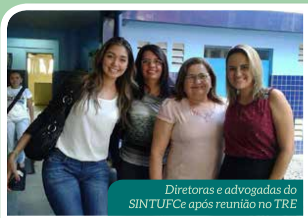
Diretoras e advogadas do SINTUFCE após reunião no TRE

O Debate será realizado no próximo dia 24 de setembro, das 19h às 21h, na Concha Acústica da UFC.