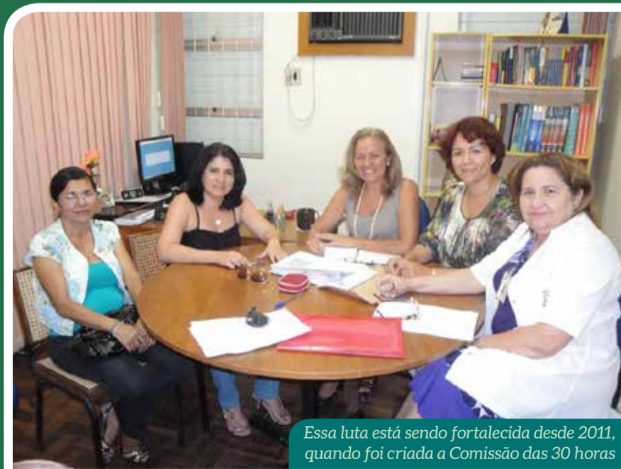
Essa luta está sendo fortalecida desde 2011, quando foi criada a Comissão das 30 horas