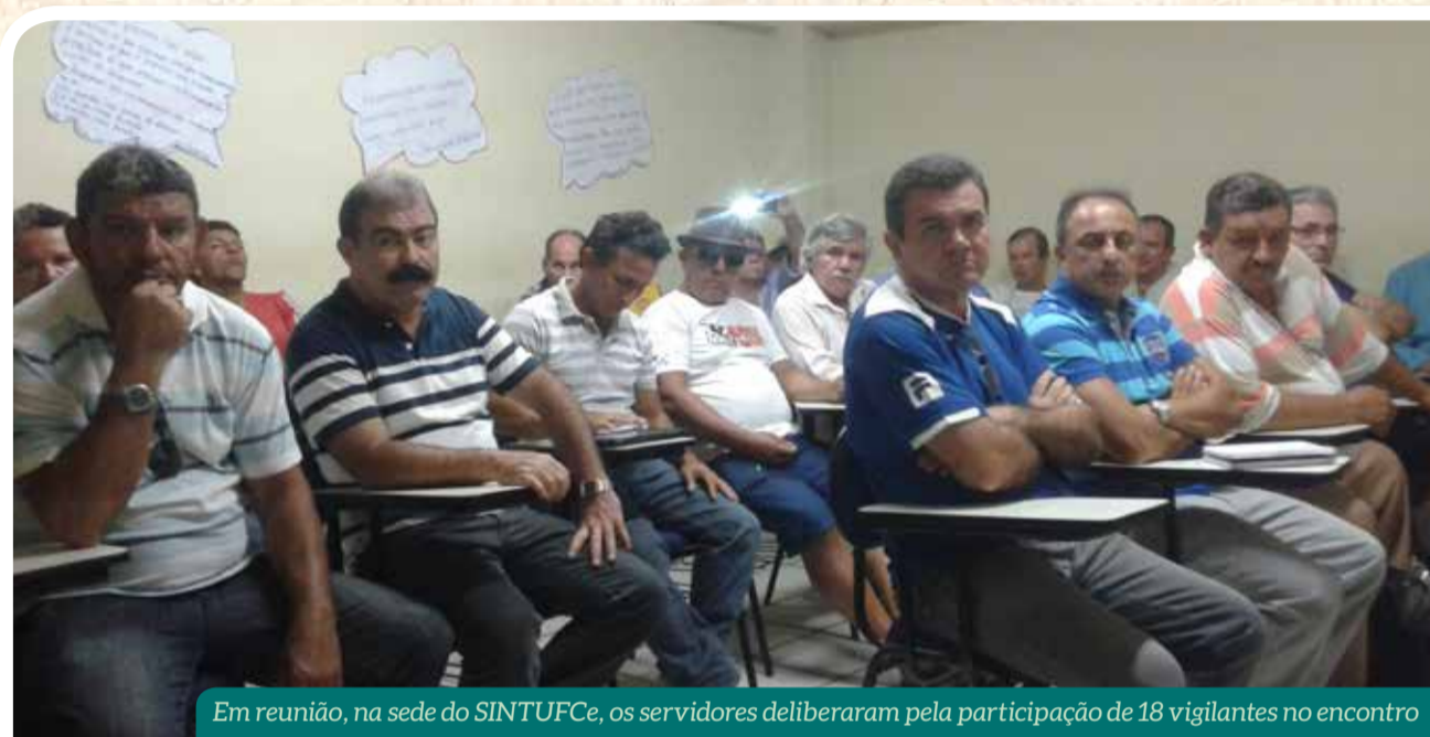
Em reunião, na sede do SINTUFCE, os servidores deliberaram pela participação de 18 vigilantes no encontro

O SINTUFCE realizou, no último dia 22 de agosto, reunião com servidores vigilantes na sede do sindicato. O XXIII Seminário Nacional de Segurança das Instituições Públicas de Ensino Superior e Educação Básica Técnica e Tecnológica pautou o encontro. Participaram da reunião 41 servidores da Universidade Federal do Ceará (UFC), que deliberaram pela participação de 18 vigilantes no evento, com a despesa de inscrição (R$ 250,00 por cada) a ser custeada pelo sindicato.