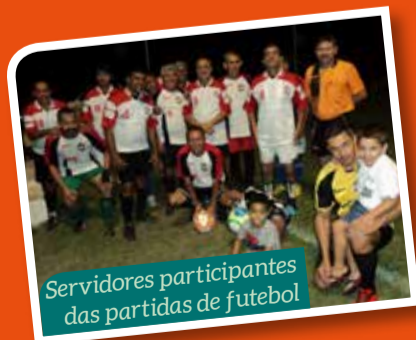
Servidores participantes das partidas de futebol

A coordenação de Esporte e Lazer do SINTUFCE promove, desde o último dia 07 de agosto, partidas de futebol, das 20h30 às 22h, no campo de futebol da Associação da PAGUE MENOS. O momento de integração e lazer acontece, sem-