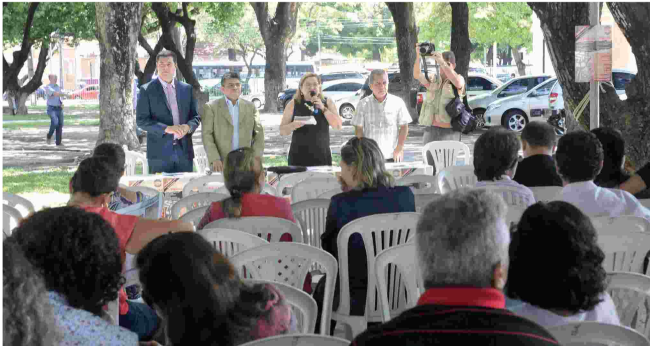
Dia 3 de março - Dia Nacional de Paralisação, em Fortaleza

Assembleias, manifestações, debates e congressos unificam os servidores federais em defesa dos direitos conquistados e em prol de reivindicações históricas