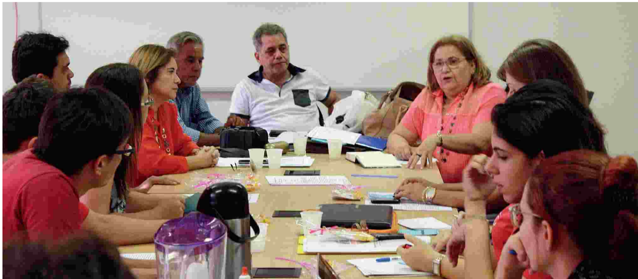
Servidores da UFC, Unilab e UFCA estarão representados no XXII Congresso da Federação de Sindicatos dos Trabalhadores de Instituições de Ensino Superior Públicas do Brasil (Confasubra)

Assembleias, manifestações, debates e congressos unificam os servidores federais em defesa dos direitos conquistados e em prol de reivindicações históricas