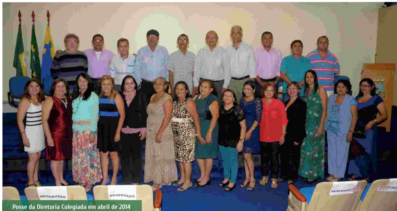
Posse da Diretoria Colegiada em abril de 2014

Vencido um ano (abril de 2014 a abril de 2015) da Gestão Vamos à Luta com Ética e Transparência (2014-2017), podemos comemorar com altivez a mudança radical nos padrões de gerenciamento político e administrativo do nosso sindicato.