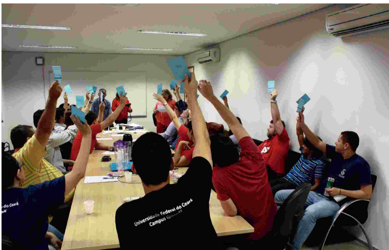
Assembleia para escolha de delegados para o Confasubra realizada em Quixadá

O Ceará estará representado no XXII Confasubra com 47 delegados.