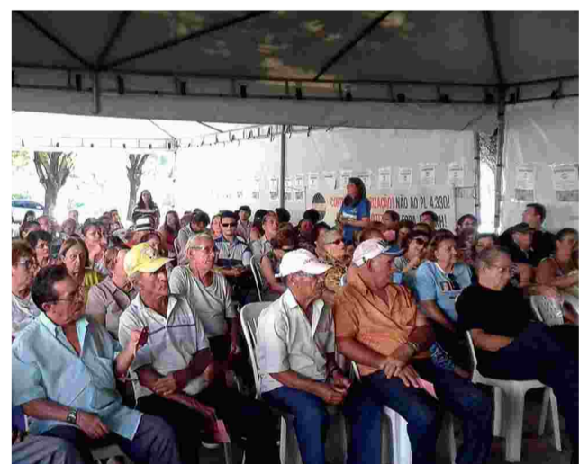
Assembleia para escolha de delegados em Fortaleza

Nós queremos uma política salarial permanente com REAL reposição das perdas inflacionárias; reajuste salarial de 27,3%; a retirada dos projetos do congresso nacional que atacam os direitos dos servidores; a isonomia salarial e de todos os benefícios entre os poderes; a regulamentação da jornada de trabalho para o máximo de 30 horas para o serviço público, sem redução salarial; a paridade Salarial entre ativos e aposentados; o fim da terceirização que retira direito dos trabalhadores; concursos públicos pelo RJU; dentre outras reivindicações.