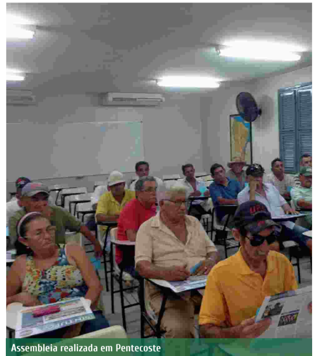
Assembleia realizada em Pentecoste

A participação de TODOS os técnico-administrativos nas assembleias e atos promovidos pelo SINTUFCE ao longo destes meses é fundamental. Nossa força se unirá à força mobilizada nos demais estados. Assim, construiremos a mudança necessária.